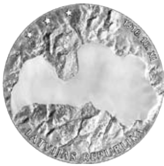
Brīvības cīņas Averss