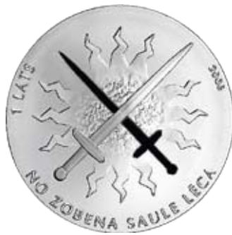
Brīvības cīņas Reverss